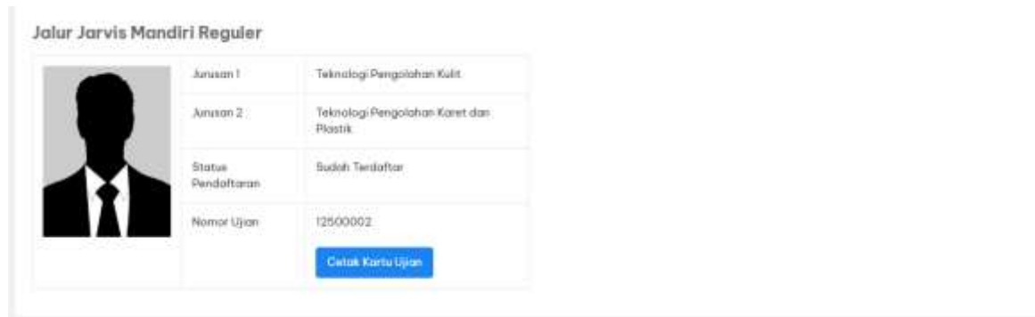
Gambar 16 Tampilan Menu Cetak Kartu Ujian

Pada menu “Selesai”, centang pernyataan yang menyatakan kebenaran data kemudian klik “selesai”. Tampilan akan berubah menjadi seperti pada gambar di bawah ini.