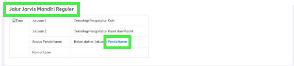
Gambar 13 Menu Jalur Jarvis Mandiri Reguler

Tampilan akan berubah kemudian pilih Jalur Jarvis Mandiri Reguler dengan klik menu “Pendaftaran” pada bagian Jalur Jarvis Mandiri Reguler.