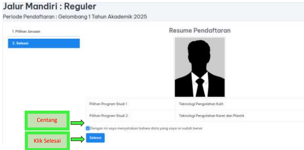
Gambar 15 Tampilan Menu Selesai Pada Jalur Jarvis mandiri reguler

Pada menu “Selesai”, centang pernyataan yang menyatakan kebenaran data kemudian klik “selesai”. Tampilan akan berubah menjadi seperti pada gambar di bawah ini.