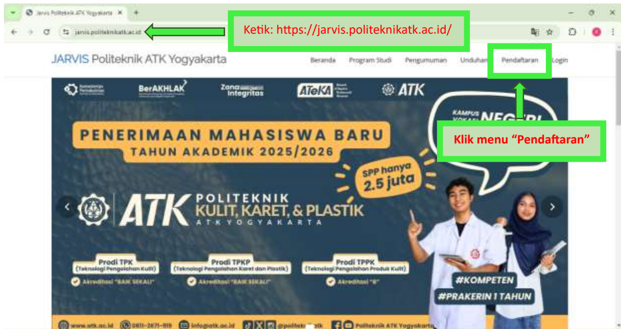
Gambar 1 Tampilan Website Jarvis.politeknikatk.ac.id

Pendaftaran Mahasiswa Baru Politeknik ATK Yogyakarta dilaksanakan melalui website JARVIS Politeknik ATK Yogyakarta. Waktu pendaftaran diselenggarakan pada tanggal 28 Oktober 2024 sampai dengan 22 Agustus 2025. Sistem pendaftaran dapat diakses di https://jarvis.politeknikatk.ac.id/ seperti gambar berikut.